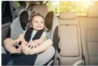
Asiento de Seguridad para niños 2 años hasta 4 años o 40