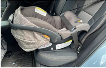
Asiento de Seguridad para bebés y niños menores de 2 años

LOS BEBÉS Y NIÑOS PEQUEÑOS DEBEN VIAJAR EN UN ASIENTO DE SEGURIDAD PARA NIÑOS HASTA QUE TENGAN 4 AÑOS Y PESEN AL MENOS 40 LIBRAS